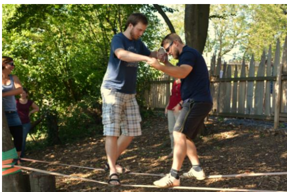
Teambuilding im Erlebnisgarten Adelshofen

Die Mischung der Themen, Dozenten, Begegnungen, Arbeitszeit, Studienzeiten usw. war sehr gut. In diesen zwei Monaten haben wir einen guten, gewissermaßen tiefen, Einblick in die DMG-Familie erhalten. Die persönlichen Erfahrungsberichte der einzelnen Mitarbeitenden im Unterricht und auch in der morgendlichen Andacht bzw. Klausurwoche waren für uns sehr hilfreich. Es war ein guter Rundumschlag zu den wohl wichtigsten Themen im Missionsdienst. Es gab Zeiten des intensiven Lernens, aber auch Zeiten um sich selbst Dinge zu erarbeiten und Menschen näher kennen zu lernen.