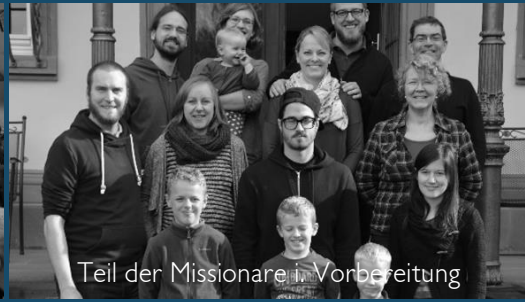
Teil der Missionare in Vorbereitung