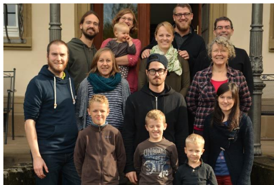
Teil d. Missionare in Vorbereitung 09+10/2016